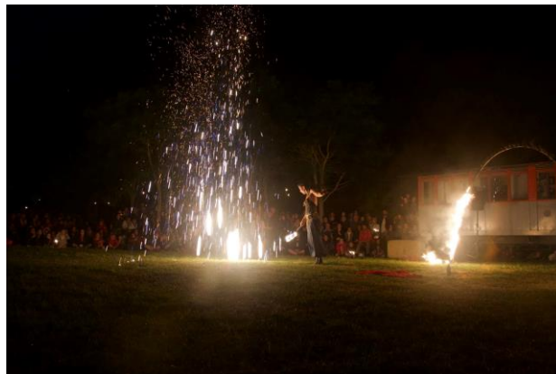
La Nuit des Feux, Langueux 2017

La Briqueterie organise tous les ans depuis 2010, un évènement artistique appelé « La Nuit des Feux ». L'idée est de mettre en exergue le parc de La Briqueterie avec sur deux jours des animations sur la thématique du feu. Des artisans s'installent avec leurs fours : forge, fonte du bronze, verre soufflé, fours papier, Raku, africain, ou à pizzas et des ateliers pour tous sont proposés. L'évènement se clôture sur un spectacle de pyrotechnie.