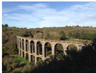
Viaduc de Douvenant