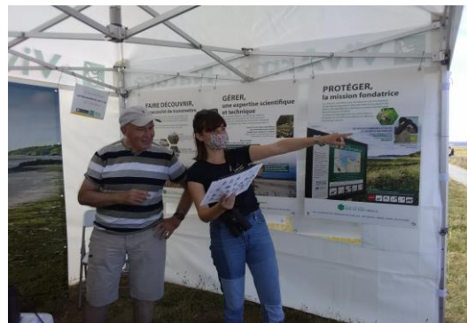
Animations auprès du grand public – Photos VivArmor Nature et Réserve Naturelle Baie de Saint Brieuc