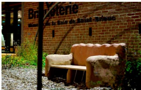
Musée de la briqueterie sur Langueux

Sans oublier les chapelles qui sont ouvertes à tous comme celle de Saint Maurice sur Lamballe Armor.