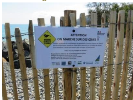
Exclos au bout de la plage du Rosaires