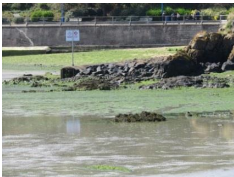
Plage du Valais

La qualité microbiologique des eaux de baignade en mer est suivie annuellement par les agences régionales de santé (ARS). Globalement, les eaux marines Bretonne sont d'excellente qualité (ARS, 2019). Parmi les 592 baignades contrôlées et classées en Bretagne en 2018, 99%, présentent une eau répondant aux exigences de qualité en vigueur. Sur le site Natura 2000 toutes les plages répondent à ces critères à l'exception notable de la plage du Valais (derrière le port du Légué).