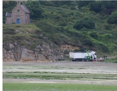
Ramassage des algues vertes sur la plage de Saint Maurice à Morieux en 2018