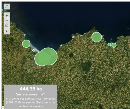
Surfaces d'estran couvertes d'ulves. Moyennes sur la période 2012-2019 (source : site Observatoire de l'environnement de Bretagne)

Planguenoual, et au Pissot, à Pléneuf, sans ramassage de l'agglomération, mais avec toutefois des opérations ponctuelles de collecte de la part de la commune pour éviter des fermetures (source : Ouest France, 11/09/2019)). Le plan de lutte contre la pollution du littoral par les algues vertes est piloté par les services de la Préfecture avec l'appui de partenaires techniques et scientifiques comme le CEVA. Ce dernier regroupe à la fois les éléments de connaissance sur les zones d'échouages d'algues vertes mais aussi des outils pour aider les collectivités à gérer au quotidien le ramassage et l'épandage des algues vertes. Il contient aussi un dispositif de crise en cas d'échouage massif. Le bilan du dispositif est transmis annuellement aux collectivités (communes, Agglomération de Saint Brieuc Armor et Agglomération de Lamballe Terre).