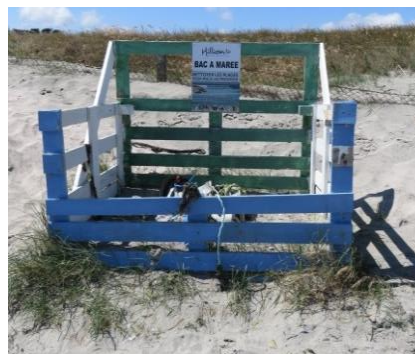
Bac à marée - Dune du Bon Abri