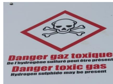
Signalétique Plage du Valais