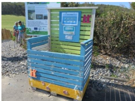
Bac à marée - plage des Rosaires