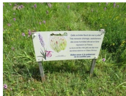
Informations aux usagers - Dune du Bon Abri

Les communes ont le pouvoir réglementaire de limiter les sources de dérangement sur les plages. Des arrêtés d'interdiction de présence des animaux sont pris par une majorité des communes en période estivale sur les plages les plus fréquentées (cf. tableau 1). Les communes peuvent aussi compléter le régime de gestion et d'encadrement des pratiques de plages dans les parties naturelles sensibles de certaines plages.