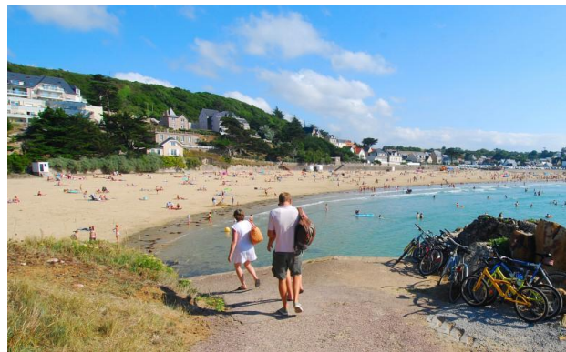
Plage de Caroual (Erquy)

*L'ensemble des activités liées aux sports nautiques et la plaisance ainsi que l'offre et la demande touristique sur le site N2000 sont traités spécifiquement dans les fiches thématiques «navigation de plaisance» «sports nautiques» et «tourisme littoral» et «pêche récréative».