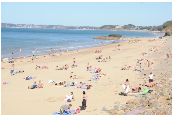
Plage des Vallées (Pléneuf Val André)

Dans le site Natura 2000, une minorité des plages sont aménagées au sens de la réglementation sanitaire 1 ; zones aménagées et délimitées matériellement (par des bouées, lignes d'eau, etc.) pour la baignade surveillée. Aucune n'affiche le pavillon bleu. Deux plages accueillent les naturistes.