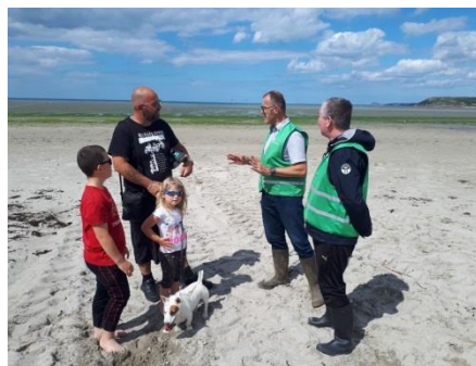
Sensibilisation du public par les ambassadeurs de la Baie