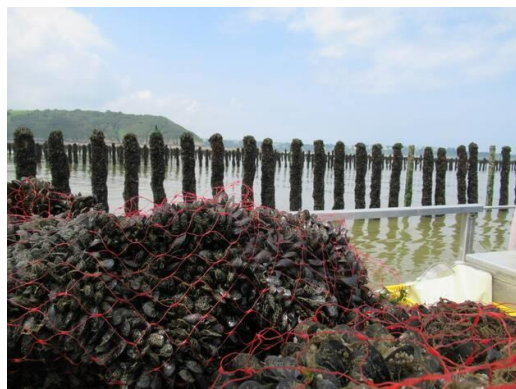
Bouchots dans l'anse de Morieux

Les naissains de moules ( Mytilus edulis ), sont captés en Charente Maritime, en Vendée (Noirmoutier), en Bretagne Sud (embouchure de la Loire) et dans la baie de la Vilaine. Au printemps, de mars à mai, les mytiliculteurs posent des collecteurs, le plus souvent des cordes de fibres de coco, à proximité des zones de reproduction. Les larves de moules s'y accrochent avant métamorphose pour former ensuite le naissain. Ces petites moules sont ensuite élevés sur place ou expédiées vers les sites de grossissement. Dans les bassins Morieux et d'Hillion et le bassin de la Fresnaye, le transfert vers les zones d'élevage (sur pieux de bouchot) se pratique avec des véhicules amphibies, des barges automatiques voire des bateaux ateliers équipés pour le lavage, le triage ou le conditionnement. Des cônes ou des tahitiennes peuvent être ajoutés à la base du pieux pour empêcher la remontée des prédateurs benthiques. Régulièrement les professionnels disposent des filets autour des pieux pour prévenir une perte de massive de moules par dégrappage. Les moules sont récoltées et commercialisées après 16 mois de croissance, généralement de juin à décembre.